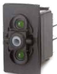
Réf. 10620 ON/OFF