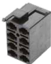
Réf. 20630 Boitier de jonction