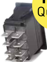
Réf. 21278 Face arrière