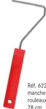
Réf. 62283 manche pour rouleaux 28 cm