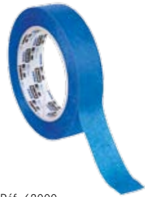
Réf. 62000 Ruban de masquage 3M 25 mm x 50 m