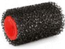
Réf. 40747 rouleaux 10 cm