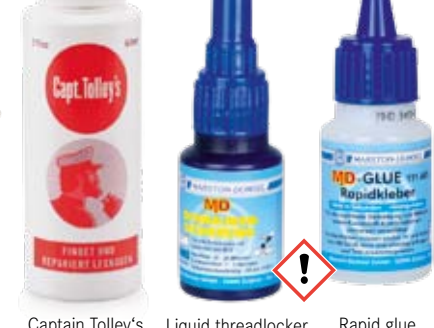
Captain Trolley's Liquid threadlocker Rapid glue

jeu d'outils pour joints Réf. 61169 € 11,95