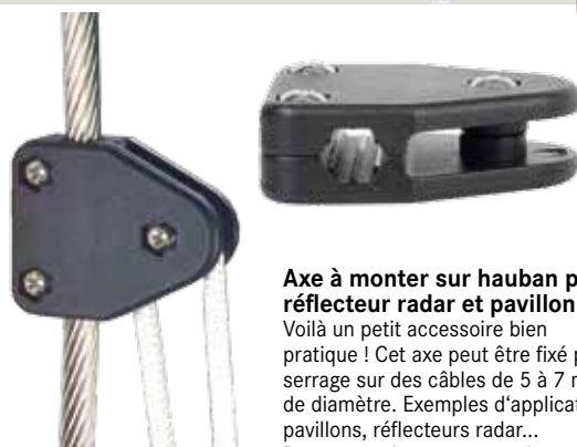
Réf. 14770 € 17,95