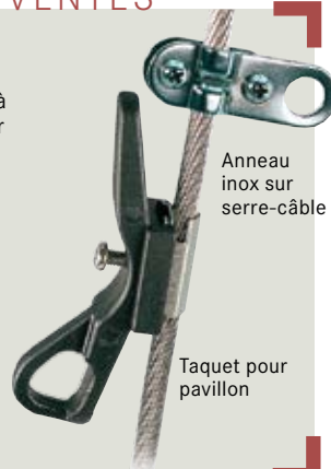
Anneau inox sur serre-câble